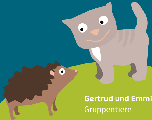
Gertrud und Emmi Gruppentiere

Der Förderverein lebt von der aktiven Mitarbeit und dem Engagement der Eltern und weiteren Unterstützern, die gemeinsam die Bildungsqualität und das soziale Miteinander im Kindergarten bereichern.